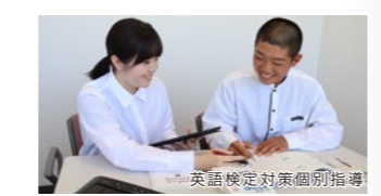
英語検定対策個別指導